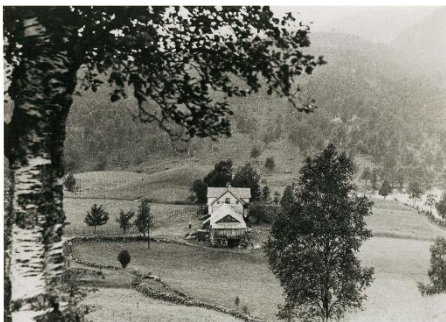
Grøtteland 1957.