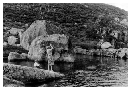
Disse fire bilder viser landskapet før både veg og hytter kom. Foto ca. 1950.