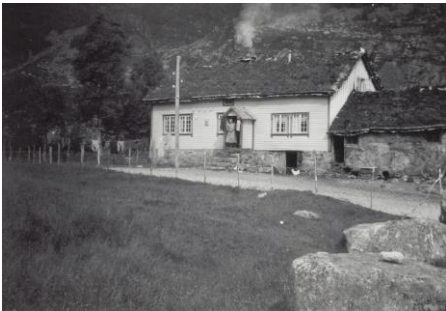
De gamle husa i Grøtteland.