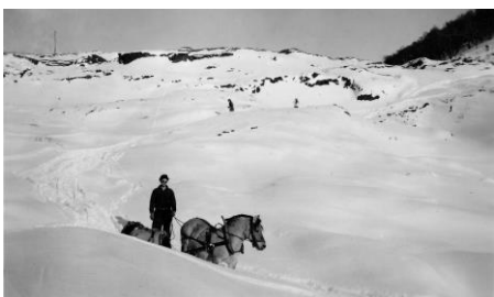
Dette er på Bergene ned mot Austumdal.