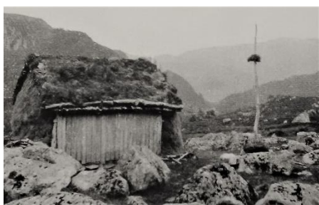
Uteløa på Grøttelandstølen. 1943.