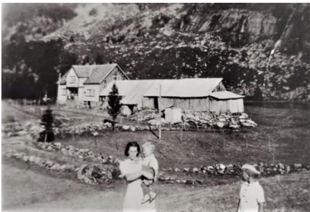
Gården Grøtteland. Med det gamle fjøset i full drift.