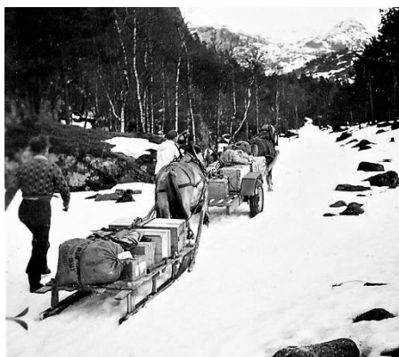
Påskeutferd til Grøtteland med provianten til skiturister 1957