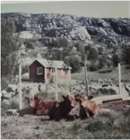
Gamlehytta på Grøtteland, slik den opprinnelig ble bygget.