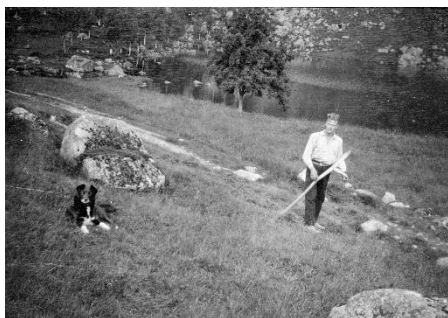
Sem i utslått ved tjørna.