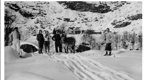
Skiturister på Grøtteland.