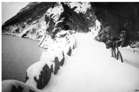
Hittil men ikke lenger, Ausrumdalsvegen 1943.